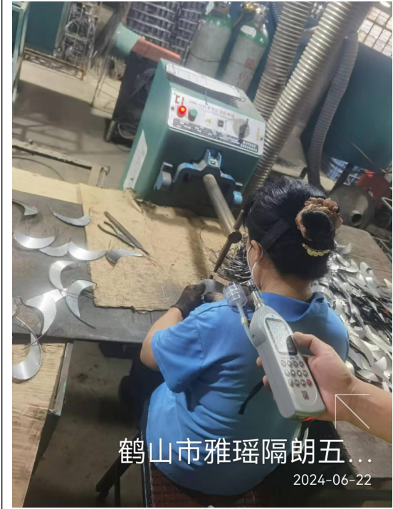
鹤山市雅瑶隔朗五...